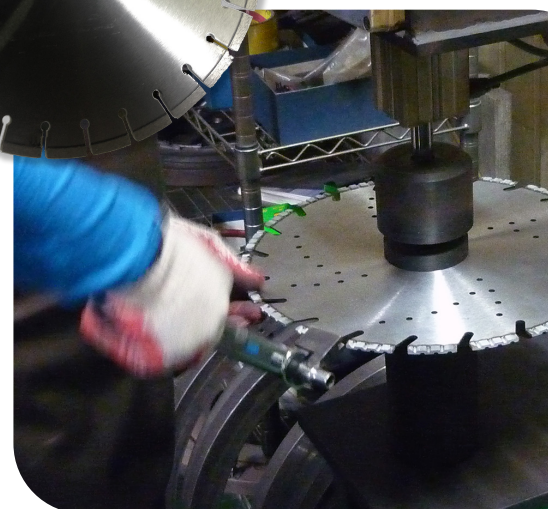
contrôle d'arrachement des segments