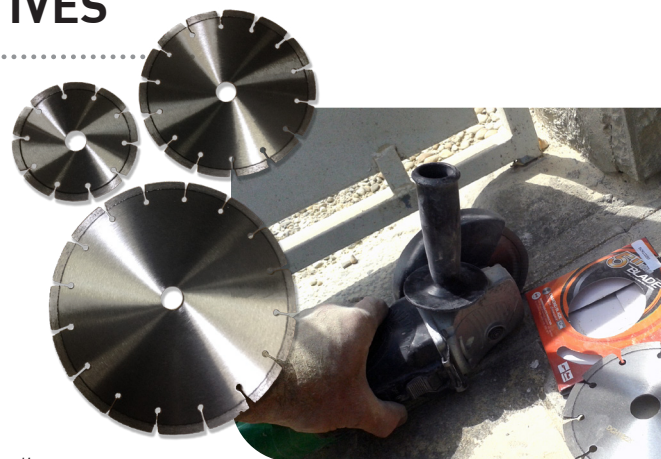
disques 125, 180 et 230 mm